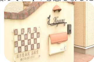
温暖堂の入り口です。

漢方整体院温暖堂 神戸市東灘区御影石町1-4-36-1 Tel:078-587-2731