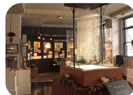
色々な真珠が展示されているパールミュージアム