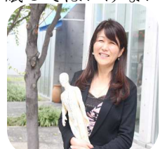
丁寧な施術でした。