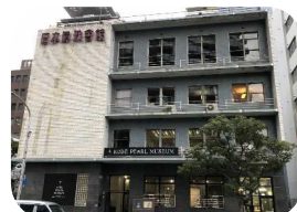
1952年に建てられた登録有形文化財の日本真珠会館