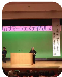
凜とした出で立ち でした。