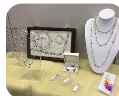
オフィスシャティナーさん