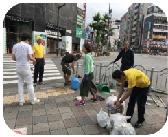
毎月第4水曜朝に、開催されている三宮掃除に学ぶ会

私は、週一回三宮の街頭掃除をしています。興味があり、やってみたいという方が結構いらっしゃいますが、どうすればいいかわからないけど、掃除の会に参加するのは大変というお声をお聞きます。そんな時は、単純に、道に落ちているゴミを拾って、余ったレジ袋などに入れることから始めるのが良いと思います。手が汚れるので、軍手やトングを使用するのも良いです。私は、ホウキと文化チリトリを使用しています。文化チリトリは、ゴミを溜めて移動ができるので、大変便利です。 「0から1への距離は、1から1000への距離より大きい」というユダヤの格言があります。物事を始めると何とかなるのですが、始めるといって壁があります。新しいことを始めるのは、大変意義があることです。 街頭掃除をしてみると、今まで気にもとめなかった物や景色に気づきます。三宮では、フラワーロードに植えられている花がとても綺麗で、結構頻繁に植え替えられていることに気づきます。 掃除が終わって、使用した掃除道具をきれいに拭いて片付けるのも重要です。きれいに片付けると、次回も気持ちよく開始することができ、継続に欠かせません。 街頭掃除で限られた時間内で完全にきれいにすることはできませんが、自分がきめた範囲内がきれいになることは、大変気持ちの良いことです。