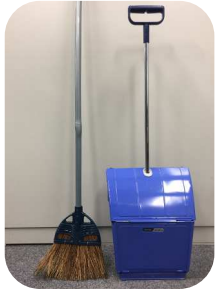
ホウキと文化チリトリ