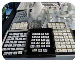
オリジナルジュエリー