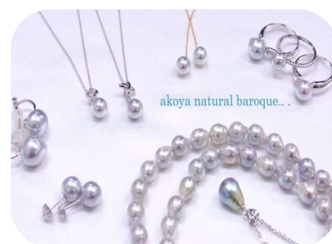
バリエーションも豊富です