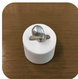
9 mm タックブローチ

通常真珠はフォーマル感が強いのですが、ナチュラルグレーのバロック形は、上品な中にも個性があって、カジュアルに装着できることも人気の要因です。