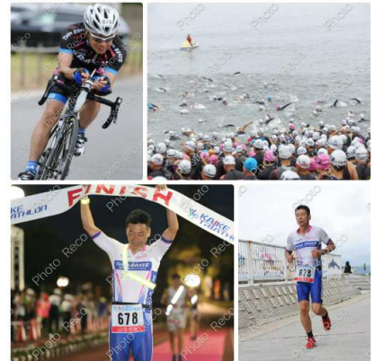
色々あった12時間50分でした

いつもなら失敗した自分を許せずにくずくずしてしまうのですが、今回は失敗した自分を笑うことができました。今回は「レースを楽しむ」という目標があったのですが、ゼッケンの着け忘れでタイムも順位も落としたことで、かえってペダル漕ぐこと、走ることに集中して、楽しむことができたのかもしれない。