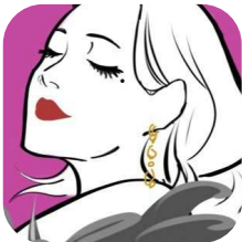
ラジオ大阪 毎週 金曜日 7:50AM~ 若宮テイチ子の ハッピープラス