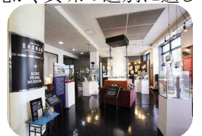
神戸パールミュージアム