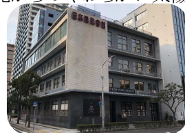
神戸の日本真珠会館

伊勢で養殖に成功したアコヤ真珠は、当時の日本市場には高価すぎて、販売先は欧米でした。当時、港がある神戸には欧米の商人が集まっていました。商人はアコヤ真珠に興味を持ち、神戸港から輸出しました。神戸は地形的に、伊勢、宇和島、九州の中間地点で、神戸に真珠加工会社が集まりました。六甲山にはね返る北からのやわらかい太陽光が、真珠の選別に適しています。真珠の買い付けに、全世界からバイヤーが神戸に来ていましたが、阪神大震災を境に、南洋真珠、黒蝶真珠、淡水真珠の生産量も増えたため、真珠の取引の中心地は香港へ移りました。真珠加工に関しては現在も神戸が中心で、真珠製品の大半は一旦神戸に集まっています。香港が不安定な今、海外からの引き合いが神戸に戻ってきて、今後入札、展示会が注目されます。