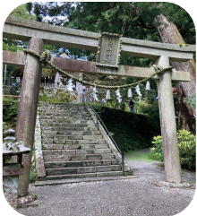
祭神 国之常立神 奈良の玉置神社