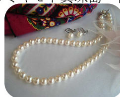
真珠本来の美しさ