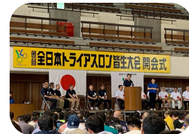
重要な競技説明会

ルールを厳守し、常に周りのことを考えながら競技していれば安全性が高まるので、参加する選手はあらためて気をつけてもらいたいです。