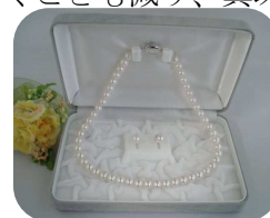
ケースに入れて保管