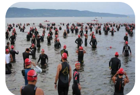
試泳、バイク試走は必須