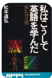
量稽古が基本です。

これからは、今まで学んだ英語力を生かして、しっかりと日本文化を英語で伝えていきます。