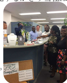
日本産真珠は人気です

海外からのお客様で、日本のお土産に真珠製品をお探しの方がいらっしゃいましたら、是非当社にご連絡ください。