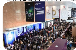
賑わっていた香港ショー

今年に入ってから海外からの引き合いが増えてきて、世界のジュエリー取引も変化の時を迎えているのかもしれませんが。