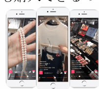
ライブ販売も急増