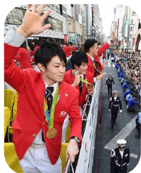
5年前は、リオオリンピックの凱旋パレードでした