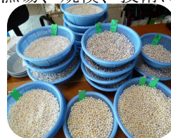
浜揚げされた原珠