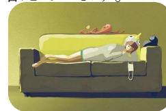
ソファでゴロゴロする

水泳に関しては、がんばって泳ぐより、長時間水に浸かっていると、体温を維持するために皮下脂肪が増えて体重が増えるケースもあります。