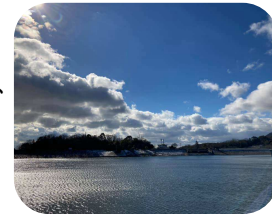
大きな空と雲と湖

音楽を聴きながら走るのは楽しいことですが、たまにはイヤホンを外して自然を楽しみながら走ることもお勧めします。