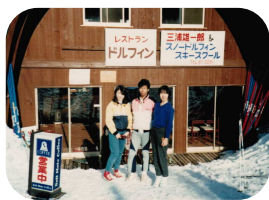
スキースクールとレストランがあった新潟県越後湯沢のロッジ

インターネットが普及し、その後にスマートフォンが普及しだして、手に入る情報量が、一気に増えました。自分が探している大抵の情報は、手軽に検索できるようになりました。以前は、本屋や図書館に行き、その本の中から探している情報を探さないといいませんでした。私が大学時代に、スキー場でアルバイトをしていた時に、情報を何か月間か遮断された時期がありました。生活していたロッジにはテレビ、ラジオ、新聞が無くカレンダーで日にちと曜日わかるぐらいでした。スキー場での一日は、早朝からスキーの練習、レッスン、ロッジのレストラン手伝いとなり、ナイタースキーで練習の後は、先輩やスタッフとお酒を飲んでスキーの話やバカ話をして、泥の様に眠る日々を繰り返し、プライベートで一人になる時間もありませんでした。世間では何が起こって何が流行っているのか全くわからず、神戸に帰った時は、浦島太郎状態でした。それでもスキー場に籠っていた時は、心身ともに充実感がありました。情報が無くても生きることに困ることはなく、逆に不必要な情報があふれていると感じます。今の世の中では、どこへ行っても情報が入ってきて、情報を遮断するのが難しいですが、何か機会がありますしたら、情報を遮断して一日過ごしてみてください。