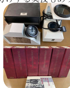
鑑別器具とテキスト