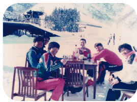
カナダから来た居候のスキーヤー後にプロレースのチャンピオンになりました