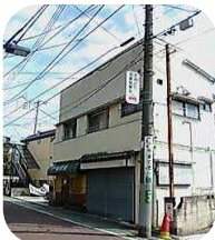
一階が食堂の安い下宿生活にも憧れました。