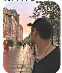
気に入っていただいているみたいです。