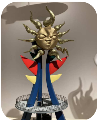
やはりこの顔がインパクトあります。