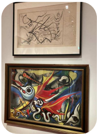
緻密に計算された構図

人間は無意識に安定を望むものですが、勇気を奮い起こして新しい一歩を踏み出したものです。