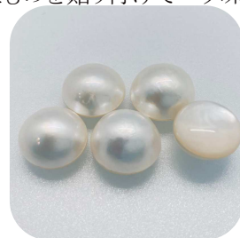
白蝶貝の半円真珠