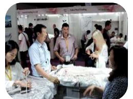
以前の香港ショー