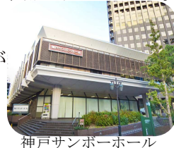
神戸サンボーホール

今回海外からの参加者の大半は香港の業者でした。中国市場での需要が高い事と、ジュエリーショーを開催できていなかったため、在庫が減っているという要因があります。真珠養殖の減産によりアコヤ真珠の価格は上昇していますが、円安が追い風となり引き合いは強い状況です。継続して開催されることが決定しているため、また海外のバイヤーさんが、神戸に頻りに訪れることを期待しています。