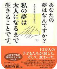
10万人の子供たちが寝たことで、変わったこと。いざという時に頼りたい本。油問哲郎著