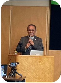
実体験のお話は心に響き説得力があります。