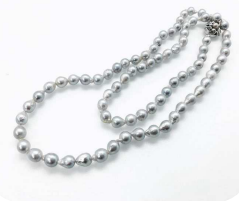
無調色ナチュラルグレー

手間暇かけて海から揚がってきた真珠素材から、その美しさを最大限に引き出してあげるのが、真珠加工業の腕の見せ所です。