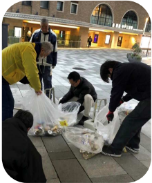
街頭清掃は簡単ですが、継続すると奥が深いです。