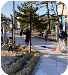
子供が参加するとゴミ拾いも明るくなります。