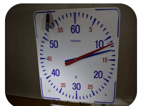
プールのペースクロック