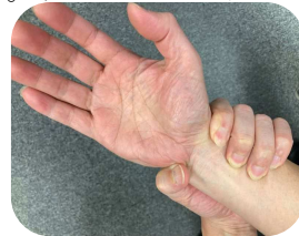
指で手首の脈を数える方法

健康の為に泳ぐ場合は、心拍数は抑えたぐらいの方が身体への負担が軽く、長い距離、長い時間を無理なく泳げて良いかと思えます。