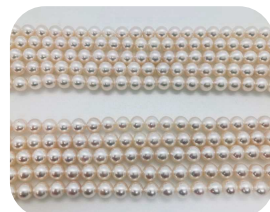
ホワイト系とピンク系

お店が勧めるから購入したけど、結局着ける機会が少なくタンスの肥やしになってしまっているというのが、お客様にとっても、当社にとっても、真珠にとっても一番残念です。ですので、私は最後はお客様に選んでいただいています。真珠との出会いは縁だと思えます。その時に会った真珠を大切にしていきたいです。