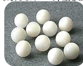
綺麗に成形された真珠核

真珠層に覆われるとわからない部分ですが、見えない場所にも手を抜かない日本の技術、文化、こだわりを感じます。海外観光客の方は、日本産アコヤ真珠をお求めになることが多く、日本ブランドへの信頼度の高さを感じます。