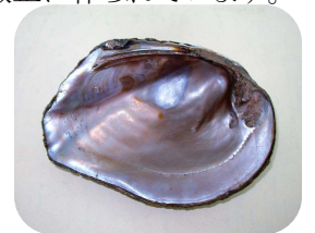
ミシシッピーの貝