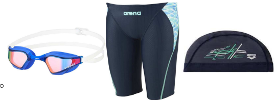
プールの塩素で劣化しますので消耗品です。

トライアスロンの水泳、自転車、マラソンの中で、一番準備するアイテムが少ないのは水泳です。基本は、水着、帽子、ゴーグルで、一見他の種目より単純と思われがちですが、実はこだわると泳ぎ、上達が大きく変わります。水着には、競泳用水着とフィットネス水着があります。フィットネス水着は分厚く、動きが制限されたり、水の抵抗が大きくなりタイムは遅くなります。競泳用水着は薄くて動きやすく、水の抵抗が減ってタイムは早くなります。帽子は、室内プールでは義務化されています。メッシュ、シリコン、テキスタイルなどあります。レースではシリコンを使用します。練習ではメッシュを使用すると頭に受ける水の量が増えて、水に対する感覚が鋭くなります。ゴーグルは、競技用、フィットネス用があります。競技用は小さく、水の抵抗が少なくなります。フィットネス用大きくて視界が広がります。私は0.1秒を競うわけではないので視界が広いフィットネス用を使用してます。曇り止めは必須アイテムです。腕時計は、スポーツウォッチ、スマートウォッチの普及が進んで、データを取るには装着したいところですが、ほとんどのプールで使用禁止です。ウェアにこだわりを持つと、レベルとモチベーションがあがります。