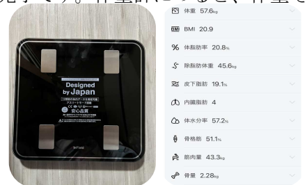
収納もしやすく便利になりました。