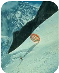
エベレストを直滑降したプロスキーヤー三浦雄一郎

衣食住が安定しても、幸せを感じないのが人間の面白いところ。たった一度の人生、自分が興味あることや、楽しいと感じることに没頭して、命を輝かせてほしいです。誰のものでもない自分の命です。