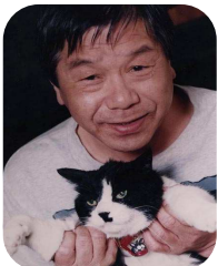
徹底したナンセンスの赤塚不二夫