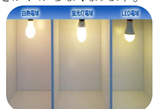
今後は LED も選択肢に