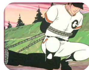
スポ根と言えば梶原一騎です