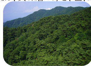
横幅が広い六甲山

実際の加工現場は、繁忙期に夜も仕事をするので、自然光に近い蛍光灯を使用し、その光に目の品質基準を合わせて作業をしています。