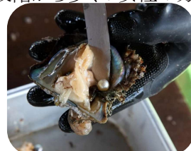
生産力の向上に期待

コラムを開始した2016年から真珠業界を取り巻く環境も大きく変化しています。2020年以降に中国市場の需要が高まり、真珠在庫が一気に品薄となり、製品、原料ともに価格が高騰しました。真珠の養殖状況は、さほど変化は見られません。更に職人の高齢化、廃業が進んでいます。養殖場では日夜科学の力を駆使して養殖技術の向上に取り組んでいると思われます。時間と経費はかかるかもしれませんが、地道な努力による品質向上を願います。