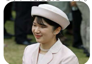
愛子様も良くお似合いです