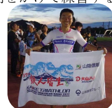
宮古島、洞爺湖、皆生の大会に参加できて本当に良かったです