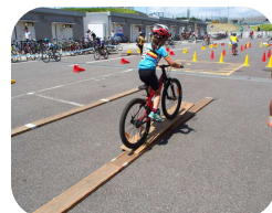
重心の位置とバランスを意識した練習です。