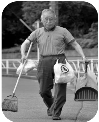
徹底的に掃除された場所は、空気感が変わります。