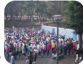
混雑するスタート前