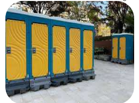
きれいな仮設トイレ