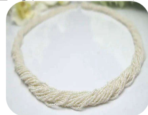
大珠、真円とはまた違った真珠の魅力を感じます。